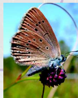
Azuré de la sanguisorbe

Gentiane pneumonanthe . Ainsi, cette tourbière revêt un intérêt international pour l'accueil des papillons avec plus de 100 espèces présentes dont deux protégées au niveau européen: le Faëet des laïches et l' Azuré de la Sanguisorbe . La gestion d'un tel milieu doit donc viser à garantir leur maintien. L' Agrion de mercure , la Corçulie à corps fin ou encore le Gomphe à cercoïdes fourchus , libellules protégées, trouvent également les conditions nécessaires à leur cycle de vie, de même que la torue Cistude d'Europe et la Loutre d'Europe . L'avifaune se distingue notamment par la présence du Grand Butor , récemment observé sur le site.