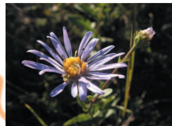
Marguerite de la Saint Michel

Puis en baissant les yeux, on constate très vite que le spectacle ne se limite pas à ce point de vue d'exception, mais qu'il est aussi tout simplement à nos pieds. La mosaïque de milieux présents favorise en effet une étonnante biodiversité. Pas moins de 26 espèces d'orchidées parsèment le coteau. Ainsi, le limodore à feuilles avortées côtoie l'ophrys bécasse, l'orchis mâle, la spiranthe d'automne et bien d'autres encore. Ce cortège d'orchidées s'accompagne d'un grand nombre d'autres espèces végétales (près de 170), des plus communes aux plus exceptionnelles, telle la marguerite de la Saint-Michel, espèce protégée en France et dont la présence ici est remarquable.