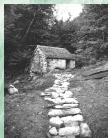
Moulin et sentier en pierres de

La présence du Desman des Pyrénées , autrefois notée au niveau du Canyon d'Anitch, est encore probable. Néanmoins, compte tenu de son extrême discrétion et des difficultés d'accès au torrent, ce mammifère aquatique rare, endémique des Pyrénées et protégé à l'échelle nationale et européenne, est délicat à prospecter et n'a pu être observé lors des récents inventaires. Sa présence sur la zone conventionnée reste donc à confirmer. Enfin, le Val de Copen est situé sur le territoire d'errance de l' Ours des Pyrénées .